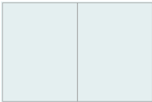
im Anschnitt 220 x 290 + 3 Millimeter Beschnitt