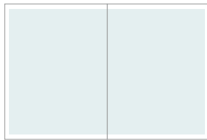
im Satzspiegel 191 x 266 mm Millimeter