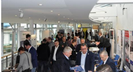
Marktplatz beim WUPPER-RING Frühjahrstreffen in Amberg.