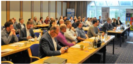
WUPPER-RING Tagung beim Frühjahrstreffen in Göttingen.